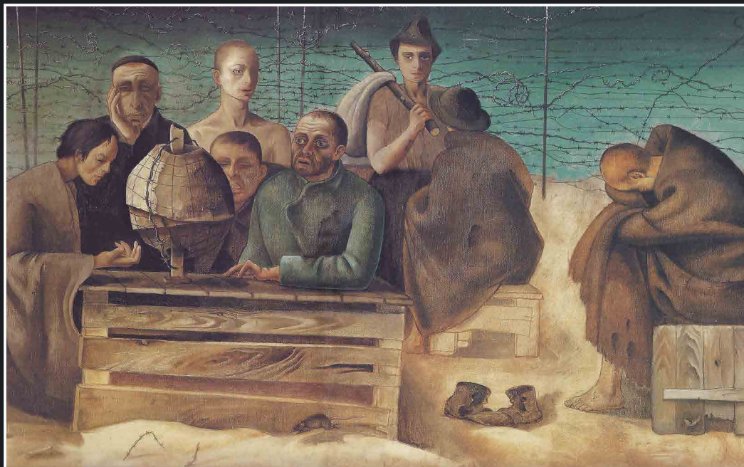
פליקס נוסבאום, "שעור בהיסטוריה", 1940, עפרונות וצבעי מים על נייר

יוצרי תיאטרון עדות - עירית ועזרא דגן, טיפול בדרמה, כתיבה בימוי והפקה