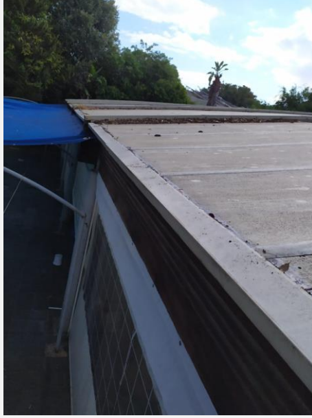
פלשונג בקצה הגג