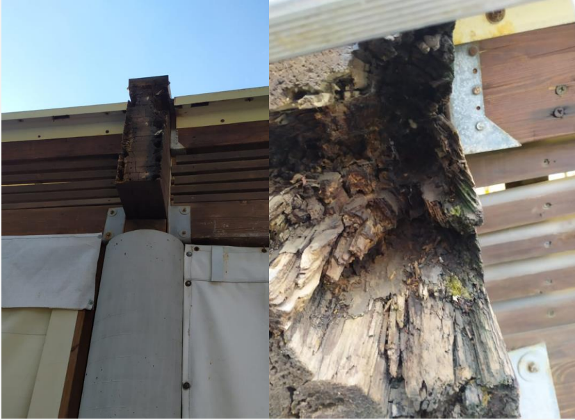
חיפוי חבק פלדה מגולוונת לקצה קורות ראשיות